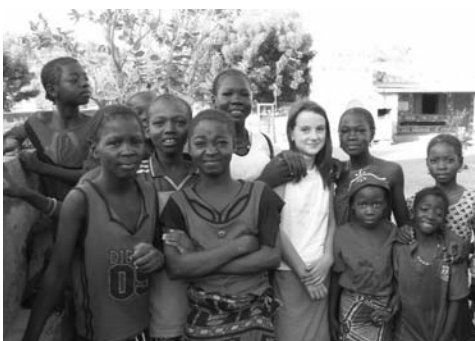
Les filles de l'internat se sont trouvées une copine