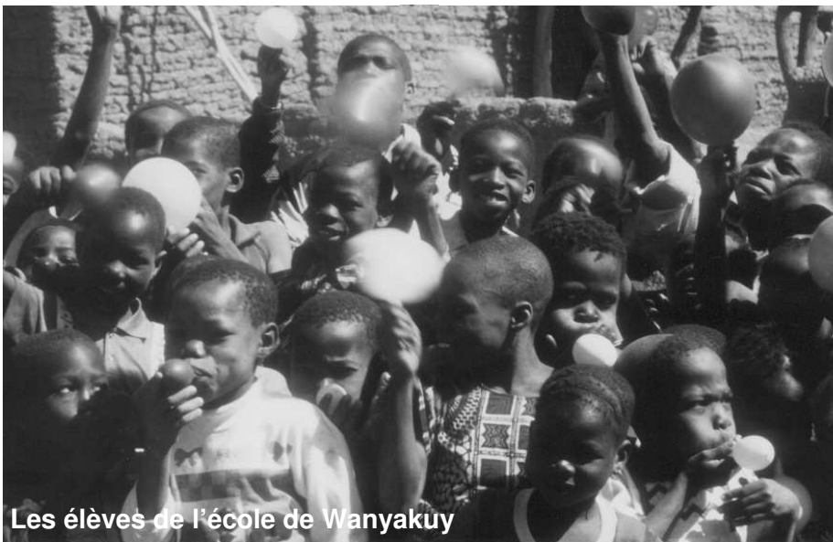
Les élèves de l'école de Wanyakuy

Voir le détail de votre action dans ce village au verso.